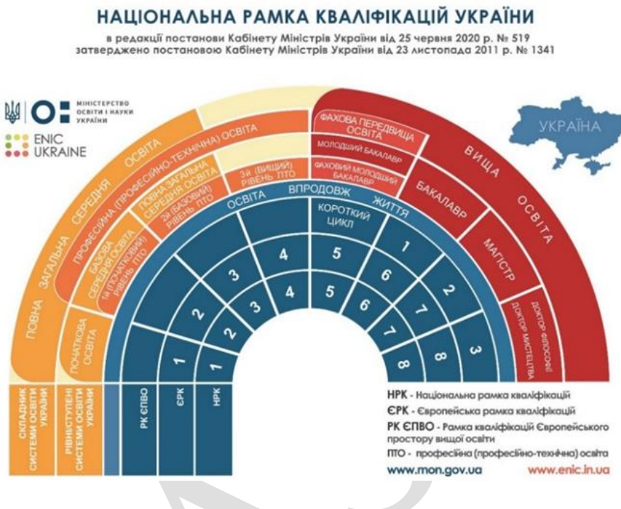
NATIONAL QUALIFICATIONS FRAMEWORK OF UKRAINE Approved by the Resolution of the Cabinet of Ministers of Ukraine № 1341, dated November 23, 2011, as amended by the Resolution of the Cabinet of Ministers of Ukraine № 519, dated June 25, 2020

Preparation in the higher education system is carried out at the initial level (short cycle) of higher education, first (bachelor's) level, second (master's) level, and third (educational-scientific / educational-fine arts) level leading to awarding a Junior Bachelor's Degree, a Bachelor's Degree, a Master's Degree, and Doctor of Philosophy Degree / Doctor of Fine Arts Degree respectively.