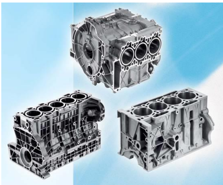
Рис. 3.1.7. Блок-картери з алюмінієвих сплавів

До 2005 року частка на ринку алюмінієвих блоків циліндрів двигуна досягла 50%. Сьогодні блоки циліндрів практично всіх бензинових двигунів виготовляють з алюмінієвих сплавів. Застосування алюмінієвих сплавів у дизельних двигунах також неухильно зростає.