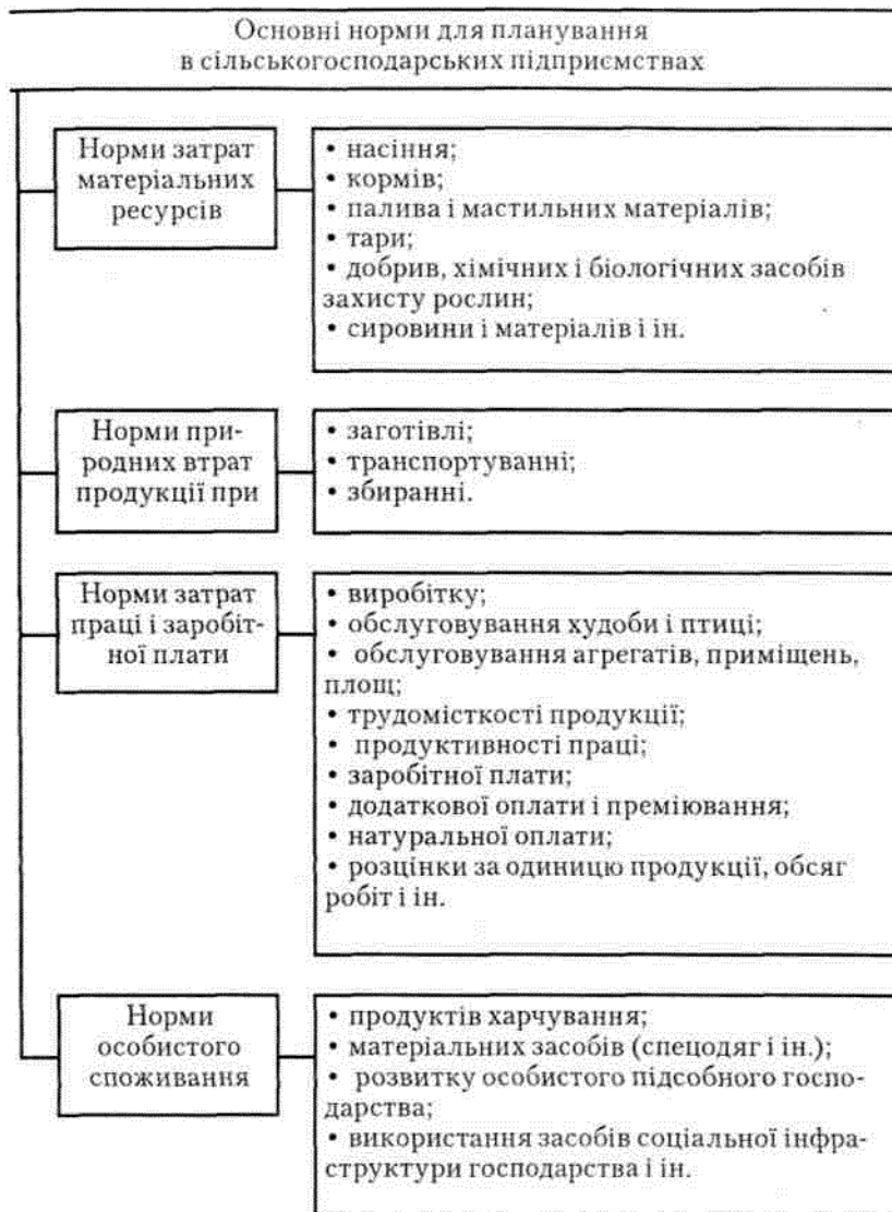
Рис.7.3. Основні норми для планування в аграрних підприємствах.

продуктивності праці, заробітної плати, додаткової оплати і преміювання; натуральної оплати; розцінки за одиницю продукції, обсяг робіт і ін.); норми особистого споживання (продуктів харчування, матеріальних засобів (спецодяг і ін.), розвитку особистого підсобного господарства, використання засобів соціальної інфраструктури господарства і ін.).