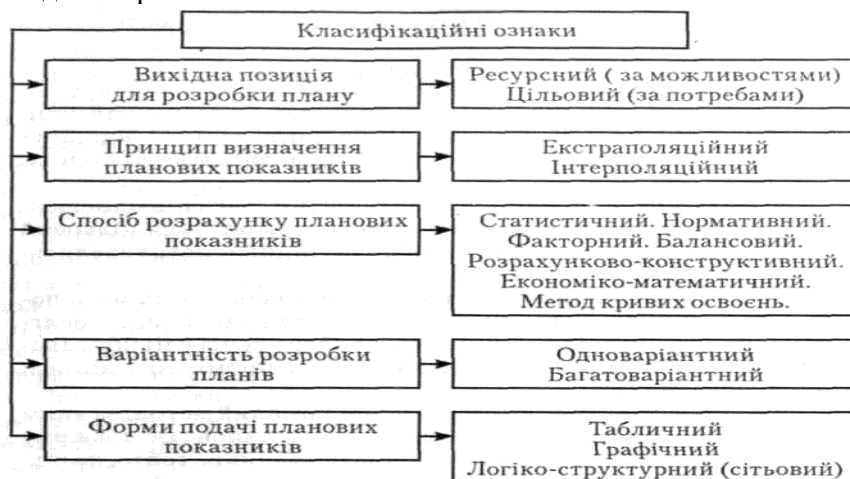
Рис. 7.2. Класифікація методів планування.

Найбільш точним є нормативний метод планування, суть якого полягає в тому, що планові показники розраховуються з використанням прогресивних норм витрачання ресурсів підприємства, з врахуванням їх змін внаслідок впровадження заходів організаційно-технічного характеру. Застосування цього методу в практиці діяльності підприємств вимагає створення відповідної нормативної бази.